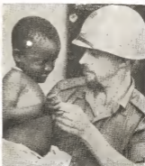
E mascota di Elizabethville